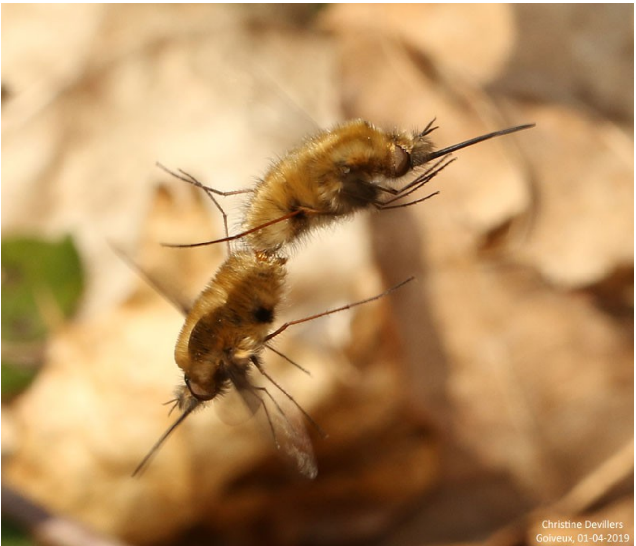
accouplement en vol de Bombylius major