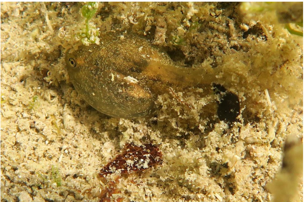
un têtard de crapaud accoucheur

Le crapaud accoucheur, Alytes obstetricans , est une espèce pionnière. Il investit les mares et les ornières peu végétalisées. Pour pouvoir l'observer encore longtemps au Goiveux, il convient de rajeunir régulièrement certaines parties des mares en curant le fond et de créer de temps en temps de nouvelles ornières. La récompense? Entendre au printemps le chant flûté du mâle appelant sa partenaire.